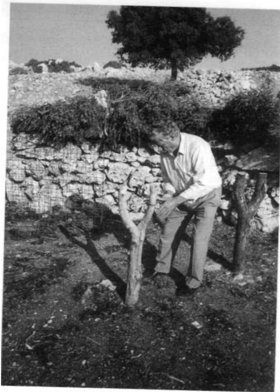
5. Εσωτερικό στρούγγας, με τις διχάλες για το κού- ρεμα των αιγών.