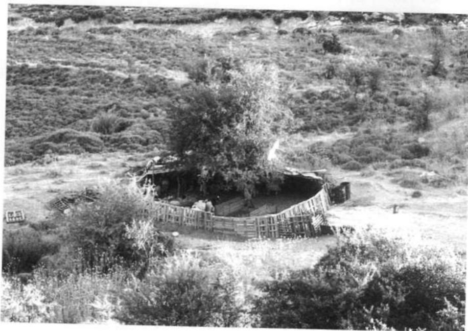
3. Νεότερη στρούγκα έξω από το χωριό Πάνακτος