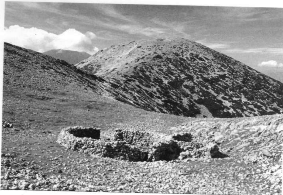
2. Παλαιά στρούγκα στην κορυφή του όρους Πάστρα (φωτ. Ν. Νέξης).