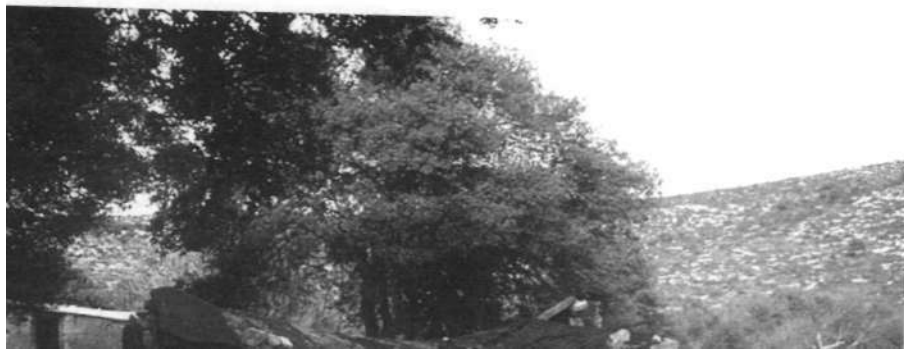
6. Παλαιά καλύβα, σε μαντρί.